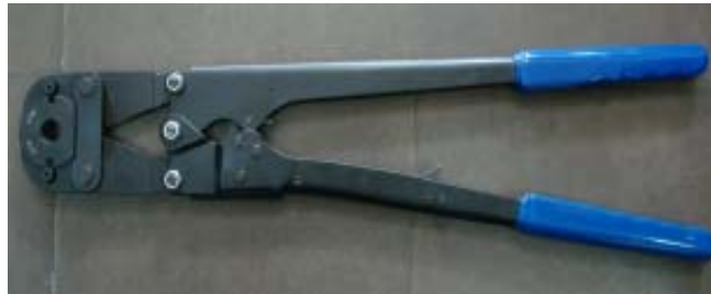
3. Monter les mâchoires correspondantes sur la pince.