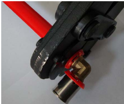
4. Placer le raccord dans la mâchoire.