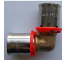
Figure 1 - Photo du raccord « PRESS-ID »

La réalisation des assemblages est effectuée à l'aide des pinces à sertir définies dans le paragraphe 3.13.