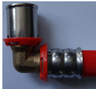
5. Presser pour terminer le montage.

Remarques : Ce montage peut aussi être réalisé avec des outils automatiques.