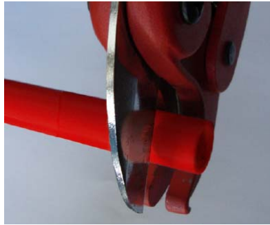
1. Couper le tube.