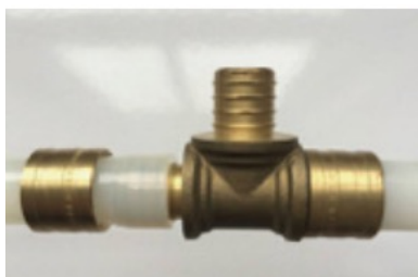
3. Introducir el extremo del accesorio en el tubo 3. Inserir extremidade do acessório para dentro do tubo