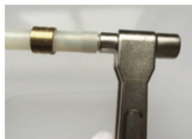
2. Abocardamos el tubo 2. Abocardamos o tubo