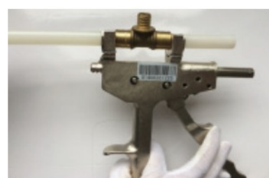
4. Colocar la unión entre las cunas de la prensa y comenzar a hacer presiones sucesivas hasta que pieza y casquillo hagan tope. 4. Coloque a união entre os berços da imprensa e começar a fazer pressões sucessivas até encostar peça e tampa.