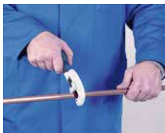
1. Corte de tubo 1. Cortar o tubo