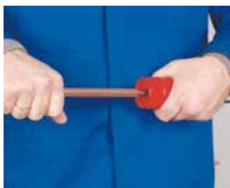
2. Rebabado 2. Rebarbar