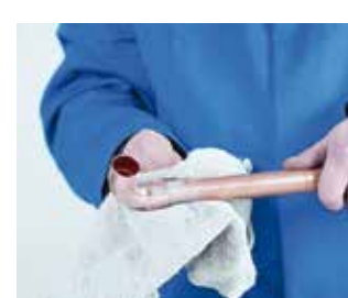
6. Limpieza final 6. Limpeza final