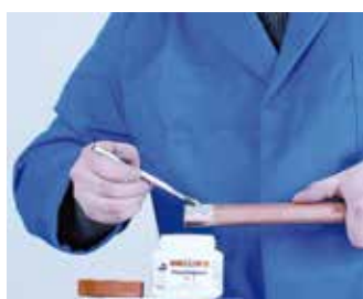
4. Aplicación del decapante 4. Aplicação do decapante