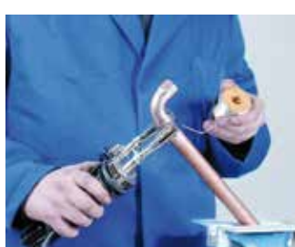
5. Aplicación de la soldadura fuerte 5. Aplicação da soldadura forte