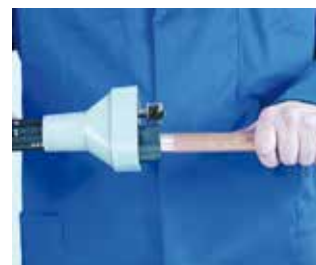
3. Limpieza exterior del tubo 3. Limpeza exterior do tubo