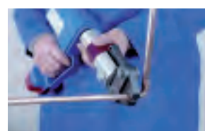
6.- Prensado 6.- Preñar